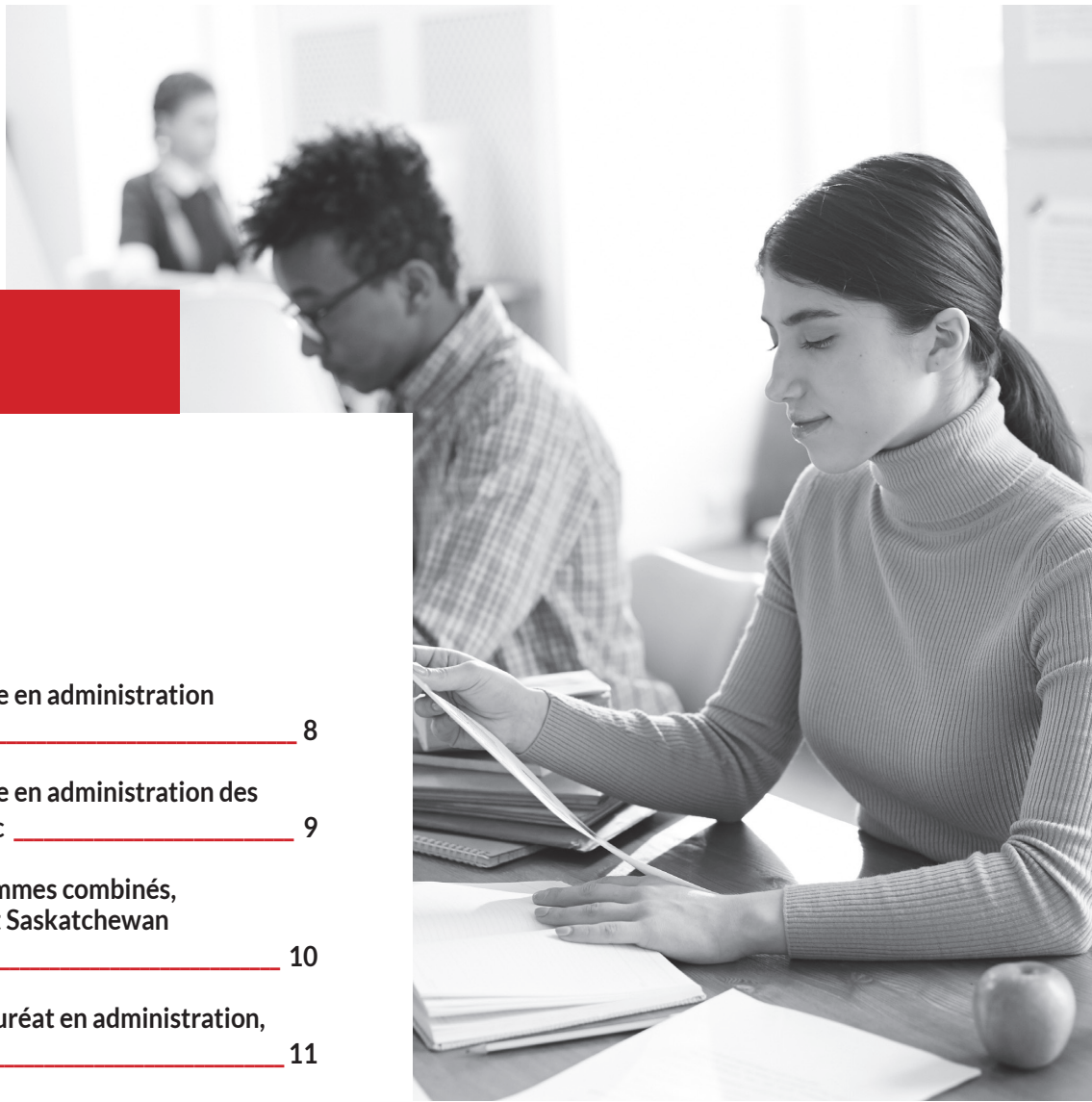
TABLE DES TABLEAUX