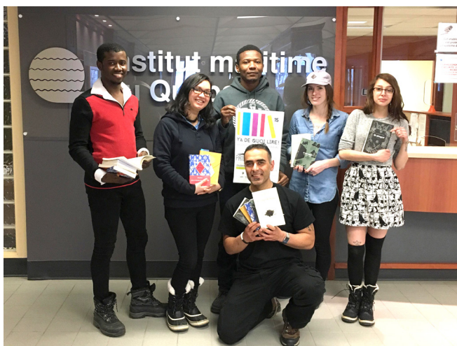
Participants de l'IMQ