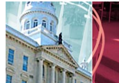
École technique et professionnelle Saint-Boniface